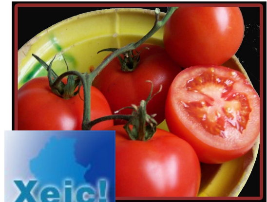
Tomaca / tomata